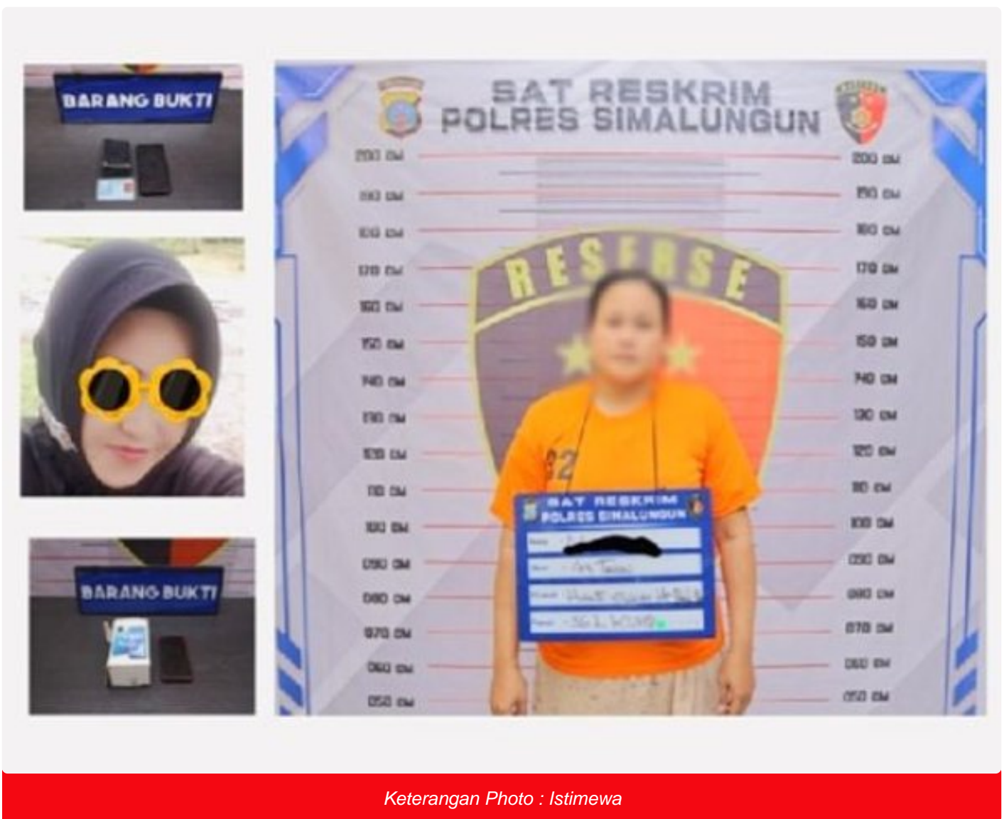
Keterangan Photo : Istimewa

SIMALUNGUN – Lebih dari sebulan lamanya, R (42) warga Kelurahan Perdagangan I, Kecamatan Bandar, Kabupaten Simalungun, melaporkan aksi pencurian yang dialaminya di Polsek Perdagangan.