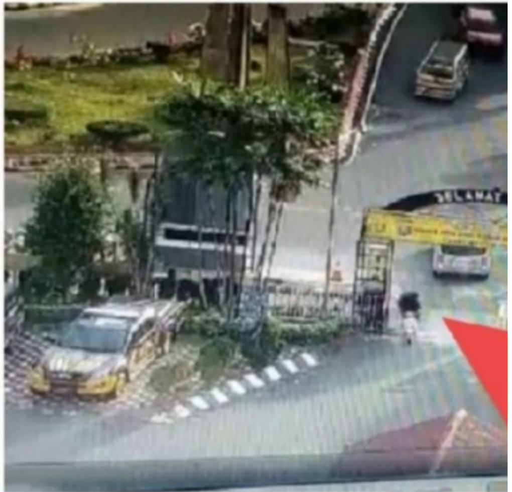
Photo Rekaman CCTV, Detik-detik Pelaku Wanita Berkendara Sepeda Motor Menabrakkan Dirinya Ke Arah Ruang Kaca SPKT Polres Pematang Siantar

PEMATANG SIANTAR- Insiden seorang wanita berusia 23 tahun mengendarai sepeda motor berkecepatan tinggi nekat menerobos pintu pagar depan.