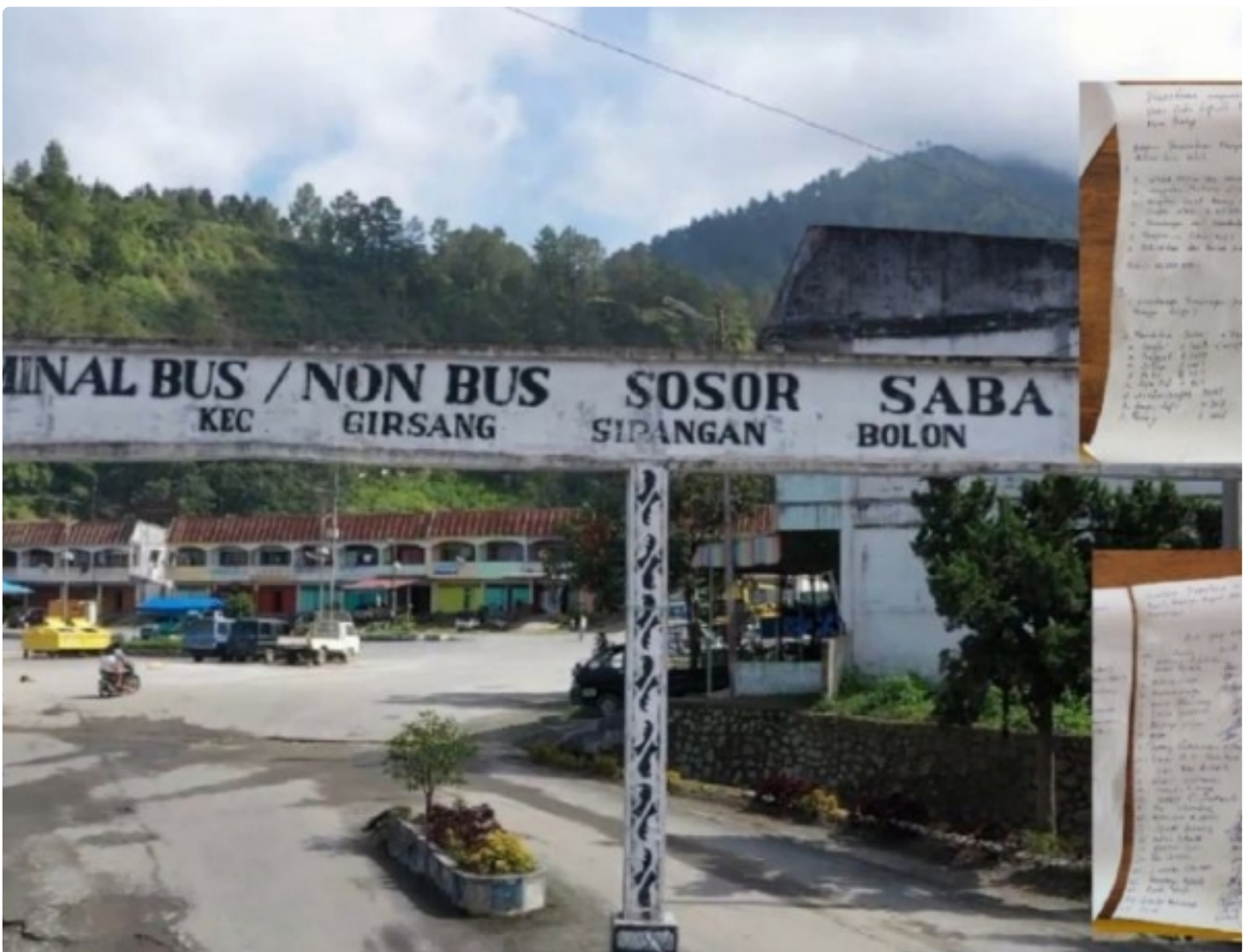
Terminal Sosor Sorba, Parapat, Kecamatan Girsang Sipanganbolon, Kabupaten Simalungun, Provinsi Sumatera Utara

SIMALUNGUN - Jelang pelaksanaan ajang Asia Pacific Rally Championship (APRC), saat ini panitia pelaksanaan datang dengan membawa sejumlah barang