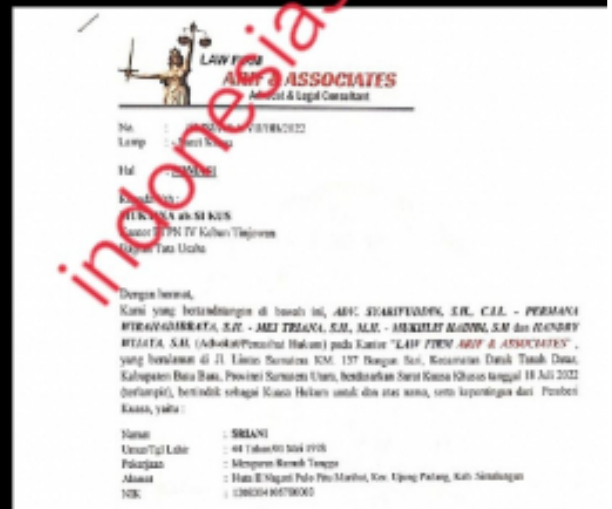
Surat Somasi Yang Disampaikan Kepada Oknum M alias Mul dan M alias Kus Berstatus Karyawan PTPN IV Unit Kebun Tinjowan, Kecamatan Ujung Padang, Kabupaten Simalungun

SIMALUNGUN- Sebelumnya dugaan perselingkuhan ke dua oknum pria beristri berstatus karyawan bagian pengamanan dengan perempuan bersuami berstatus karyawan bagian tata usaha telah didamaikan dan menandatangani surat pernyataan.